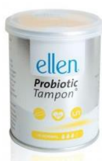
Normal, 12 Stück