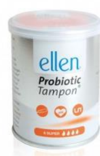
Super, 8 Stück

je 7,20 Euro (unverbindliche Preisempfehlung)