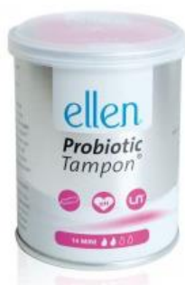
Mini, 14 Stück

ELLEN® wird wie ein normaler Tampon nur während der Periode angewendet. Für einen besonders guten Effekt empfiehlt sich die regelmäßige Verwendung während drei bis vier aufeinanderfolgender Perioden. ELLEN® ist für den langfristigen Einsatz geeignet und kann nicht überdosiert werden. ELLEN® gibt es mit verschiedenen Aufnahmefähigkeiten: Mini, Normal und Super.